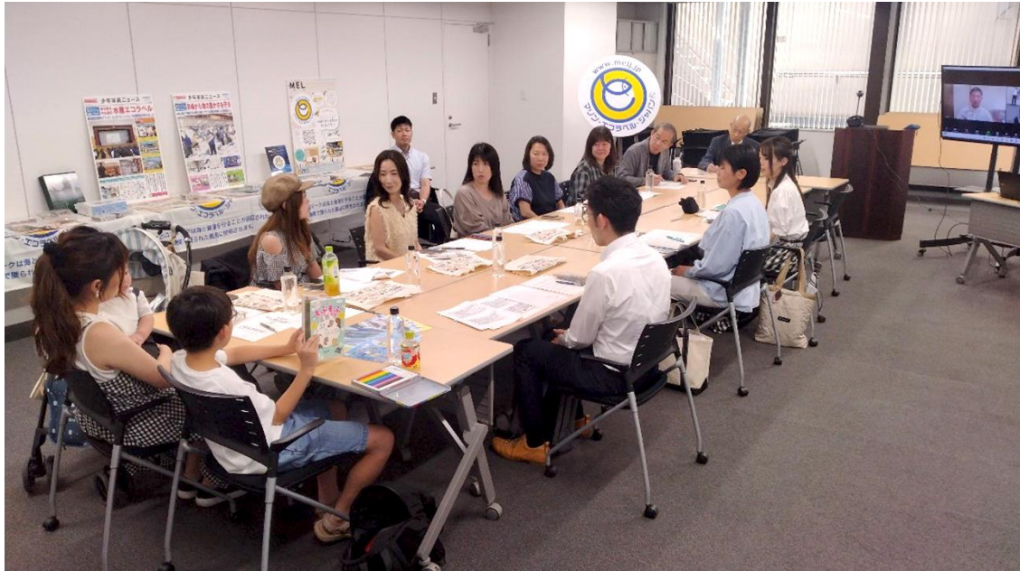
第4期 MEL アンバサダー キックオフミーティング