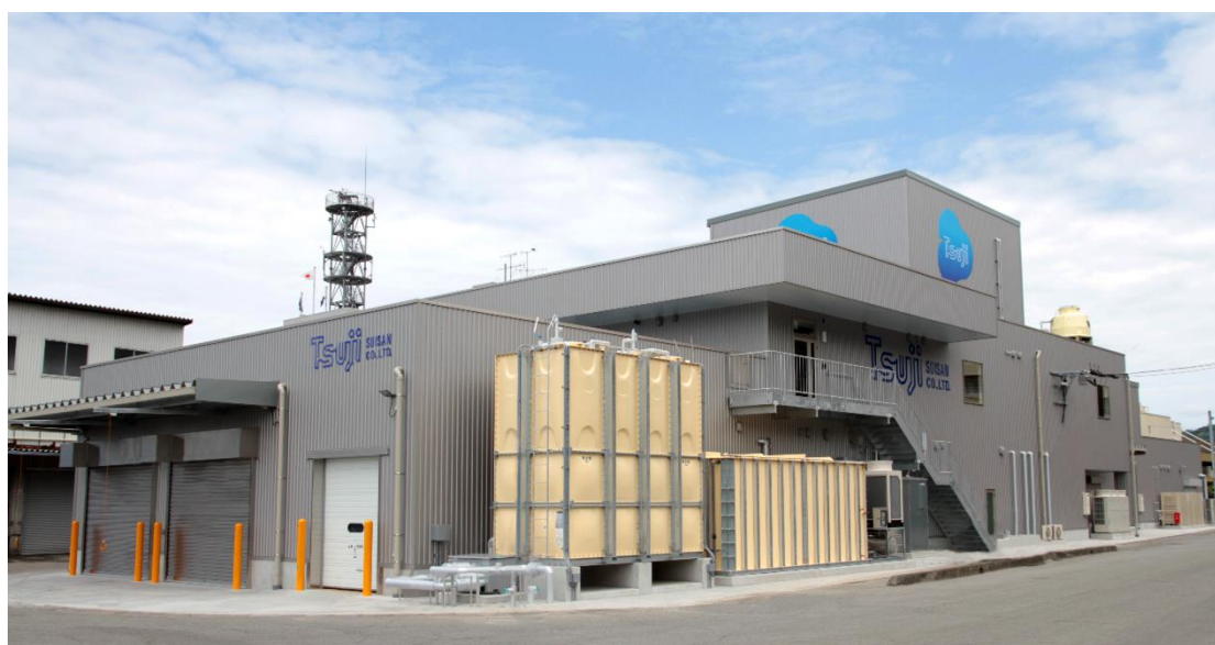
辻水産様 第一加工場

CoC 認証をより活かすために 2023 年 6 月に新加工場を稼働させました。それにより製造能力が向上し生産管理と衛生環境を充実させました。私達の中では取り入れたい世界基準と守りたい日本の文化、この融合は大きな問題でした。日本は島国として古来より魚と共に文明を築いてきた長い歴史があります。海で命を繋いできた者は海を犠牲にすることはありません。一部の自分さえ良ければと考える人を規制する仕組みは必要ですが、日本の魚文化を理解した MEL 認証はどの国際認証より日本の生産者に相応しい国際認証と思います。