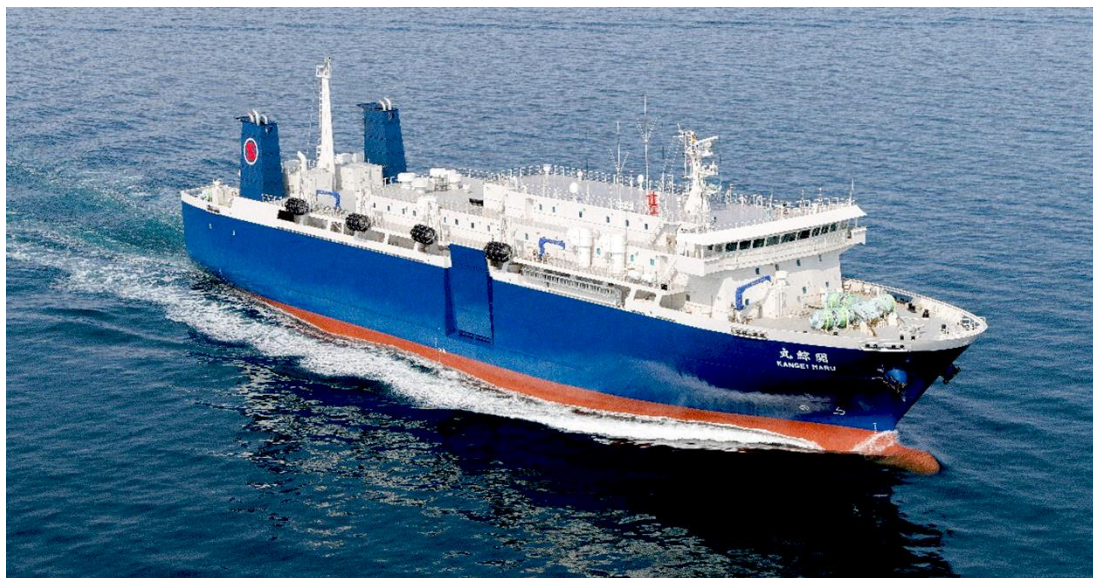
公式試運転中の関鯨丸